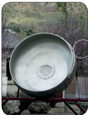
Le Tassou (Bruejols)